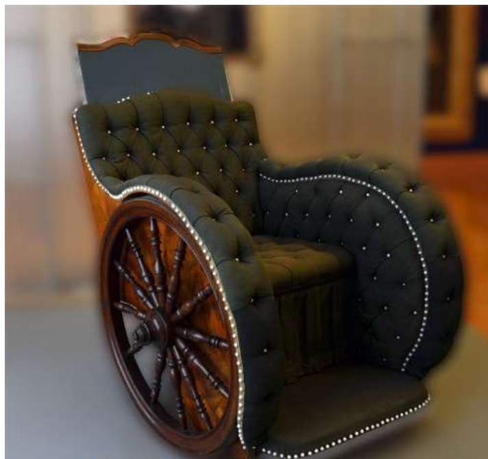
Коляска, сконструированная и сделанная царем собственноручно

67. Аширова, Эльмира. Инвалидная коляска для "дядьки" : крепкая дружба всю жизнь связывала Петра и его воспитателя Бориса Голицына / Э. Аширова // Родина. - 2022. - № 5. - С. 52-55.