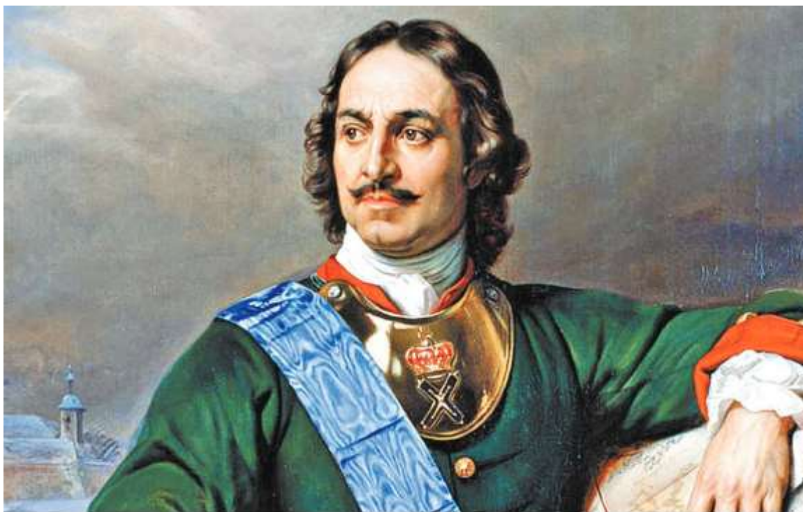
Портрет Петра Первого. Художник Поль Деларош

181. Экштут, Семён. Дым петровского отечества : он и сегодня доносится до нас из курных избёнок, в которых ночевал император / С. Экштут // Родина. - 2022. - № 5. - С. 14-20.