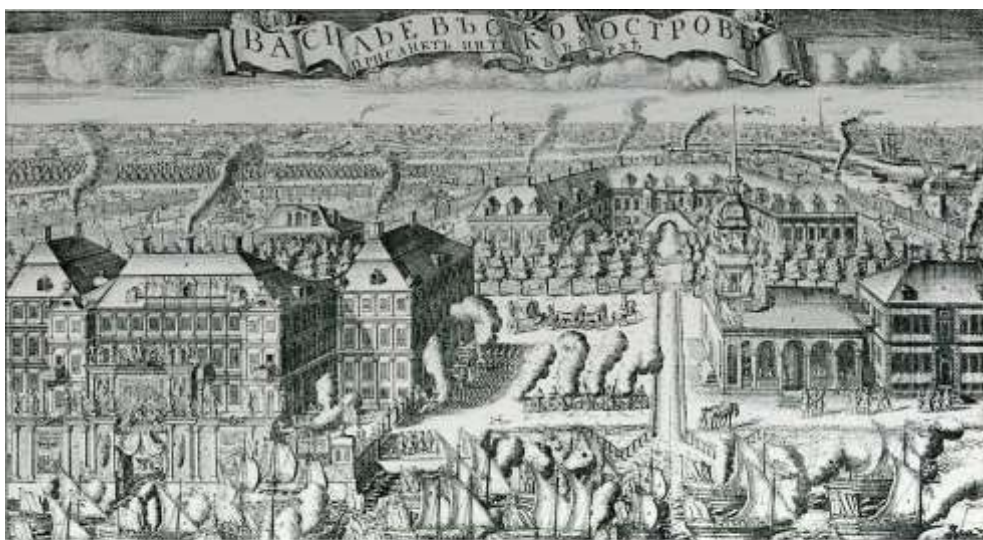
А. Зубов. Вид Васильевского острова и триумфального ввезда шведских судов в Петербург после победы при Гангуте 9 сентября 1714 года.

64. Чагадаева, Ольга. Пётр I: молодой отрок должен быть бодр, трудолюбив и беспокоен, подобно как в часах маятник : [царские требования к подрастающему поколению не утратили актуальности в современной школе] / О. Чагадаева // Родина. - 2022. - № 5. - С. 10-13.